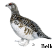
Belka Lagopus muta

Belka je ptica iz družine koconogih kur, ki se pojavlja nad gozdno mejo. Pozimi se njeno perje obarva belo, da je varna pred plenilci. Na območju Mangrta živi ena najštevilnejših populacij v Alpah.