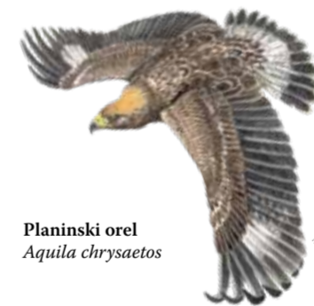
Planinski orel Aquila chrysaetos