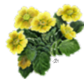
Gorska sretena Geum montanum

Travnate planjave pod vrhom Mangrta so najlepše v začetku julija, ko zažarijo v osupljivem ognjemetu tisočerih barv. Zaradi pester flore in rastlinskih posebnosti slovijo daleč naokoli. Tu je eno redkih ali edino rastišče gorske sretene, islandske potočarke, klasnatega ovsenca, črnega pelina ... Pri občudovalcih vzbujajo spoštovanje tudi bohoten alpski gozd.