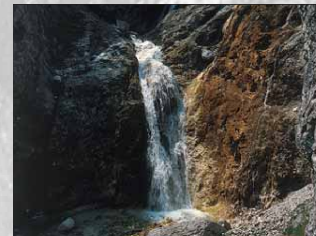
Slap v dolini Kot

objemata prostrani visoki kraški planoti Poključka in Mežakla. Dolinsko dno je ozko. Ponekod so na apnenčastih ledeniških nanosih nastali grbinasti travniki. V zadnjih desetletjih jih zaradi hitrejšje obdelave vse