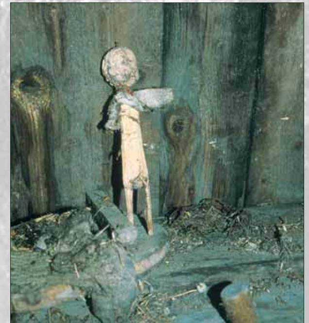
Otroška igrača z glavo baročnega angela

Obnovljeno gospodarsko poslopje ima muzejski in razstavnici namen, saj so v njem predstavljeni kmečko orodje in vozovi, hkrati pa Triglavski narodni park, v katerem leži Pocarjeva domačija.