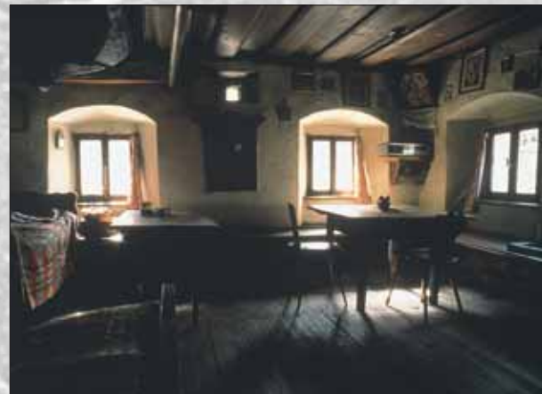
Osrednji prostor - hiša - leta 1993

Stanovanjska stavba je zidana, pritlična, tradicionalnega tlorisa, njeni prostori pa so nanizani na osrednjo vežo. Glavni bivalni prostor je "hiša" s "hišno kamro" in z letnico 1775 na stropnem tramu. Iz veže je dostop v črno kuhinjo, v kamro za preužitkarje in v klet za spravilo repe, zelja, korenja, krompirja. Iz veže vodijo tudi stopnice na podstrežje - na njem se ponovi tlorisna razporeditev prostorov, vendar v preprostejši izvedbi. Tu so v številnih skrinjah hranili oblačila in osebne