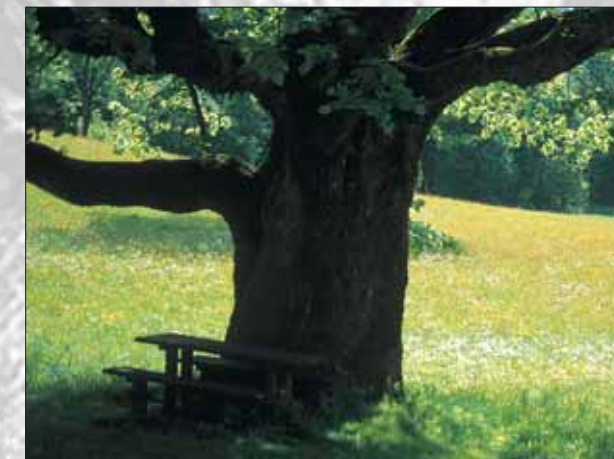
Deblo mogočne Gogalove lipe

Dolina Radovne leži na robnem območju Triglavskega narodnega parka, globoko vrezana v SV del apnenčastih Julijskih Alp. Začne se na izteku dolin Krme in Kota, katerih potoka je reka Radovna pretočila v geološki preteklosti, in se razprostira od SZ na JV. Do Krnice jo