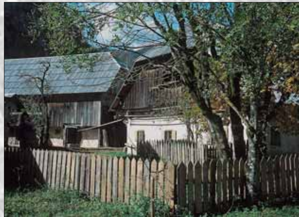
Garkelc - manjši ograjen vrt - pred hišo

Bogastvo Pocarjeve domačije so bili gozdovi, pašniki, rovti, travniki in njive, posredno pa se njena gospodarska moč vidi v velikosti stanovanjske hiše in gospodarskega poslopja. Živinoreja in z njo povezane dejavnosti so zagotavljale glavni zaslužek in hrano za preživetje. Kljub obsežni posesti je bilo stavbišče za domačijo izbrano varčno in pretehtano. Ob nekdanji poti med travniki je v gručo strnjena stanovanjska hiša in gospodarsko poslopje ter manjši hlev za drobnico, leseni svinjak in stegnjeni kozolec.