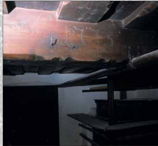
Letnica 1775 na hišnem tramu

Stanovanjska stavba je zidana, pritlična, tradicionalnega tlorisa, njeni prostori pa so nanizani na osrednjo vežo. Glavni bivalni prostor je "hiša" s "hišno kamro" in z letnico 1775 na stropnem tramu. Iz veže je dostop v črno kuhinjo, v kamro za preužitkarje in v klet za spravilo repe, zelja, korenja, krompirja. Iz veže vodijo tudi stopnice na podstrežje - na njem se ponovi tlorisna razporeditev prostorov, vendar v preprostejši izvedbi. Tu so v številnih skrinjah hranili oblačila in osebne