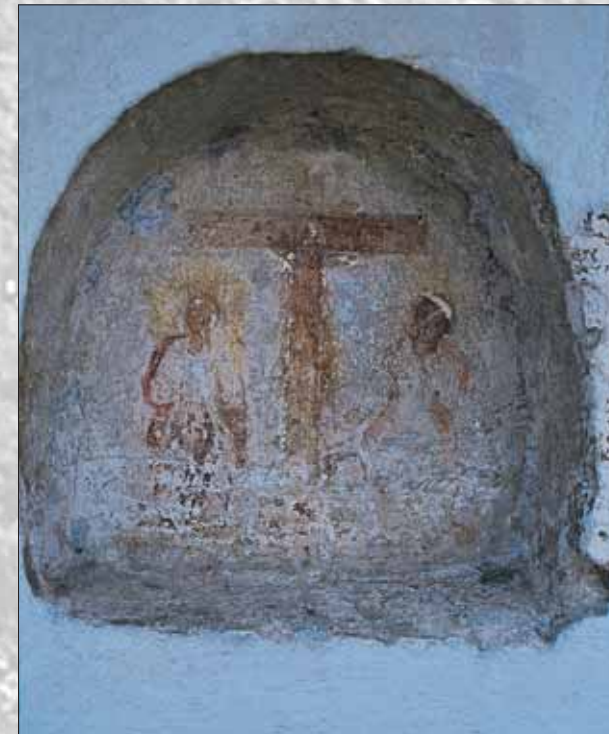
Freska na pročelju

Zunanost stanovanjske stavbe je ostala skoraj nespremenjena. Vhod v hišo je zidan, polkrožen, vrata so stara, lesena, enokrilna. Nad njimi je na tram ostrejša pritrjena stara, na deščico izpisana hišna številka 13. Hišno pročelje krasita freska Višarske Marije in manjša freska Križanega z Marijama. Stanovanjsko hišo