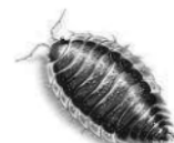
mokrica ali kočič

Kaj o gozdu ti je najbolj ostalo v spominu? Nariši!