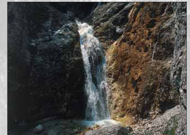
Slap v dolini Kot

objemata prostrani visoki kraški planoti Poključka in Mežakla. Dolinsko dno je ozko. Ponekod so na apnenčastih ledeniških nanosih nastali grbinasti travniki. V zadnjih desetletjih jih zaradi hitrejšje obdelave vse