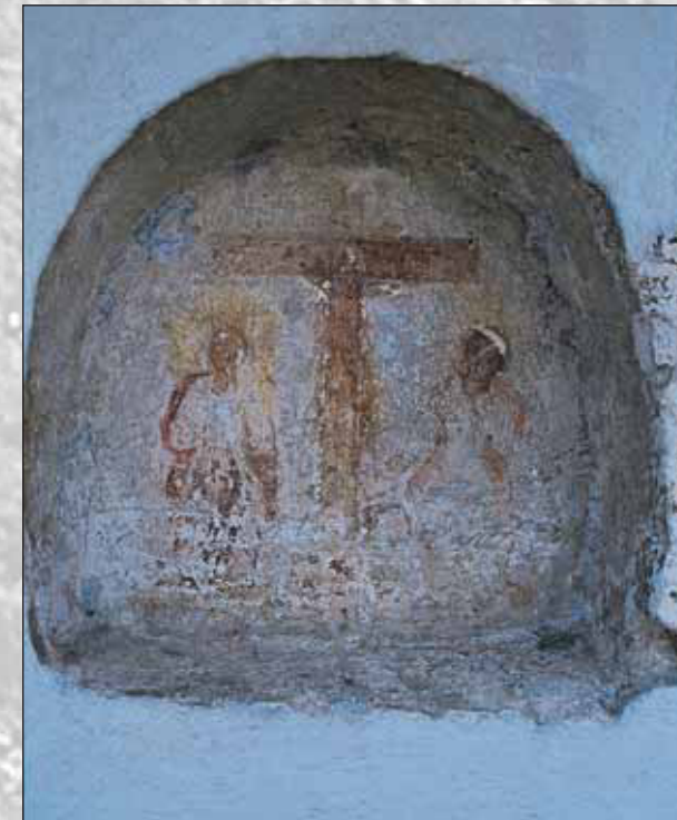
Freska na pročelju

Zunanost stanovanjske stavbe je ostala skoraj nespremenjena. Vhod v hišo je zidan, polkrožen, vrata so stara, lesena, enokrnlna. Nad njimi je na tram ostrejša pritrjena stara, na deščico izpisana hišna številka 13. Hišno pročelje krasi freska Višarske Marije in manjša freska Križanega z Marijama. Stanovanjsko hišo