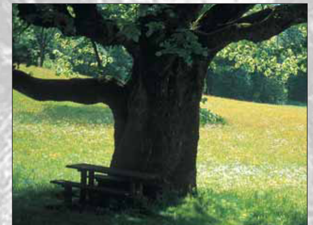
Deblo mogočne Gogalove lipe

Dolina Radovne leži na robnem območju Triglavskega narodnega parka, globoko vrezana v SV del apnenčastih Julijskih Alp. Začne se na izteku dolin Krme in Kota, katerih potoka je reka Radovna pretočila v geološki preteklosti, in se razprostira od SZ na JV. Do Krnice jo