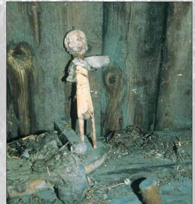
Otroška igrača z glavo baročnega angela

Obnovljeno gospodarsko poslopje ima muzejski in razstavni namen, saj so v njem predstavljeni kmečko orodje in vozovi, hkrati pa Triglavski narodni park, v katerem leži Pocarjeva domačija.