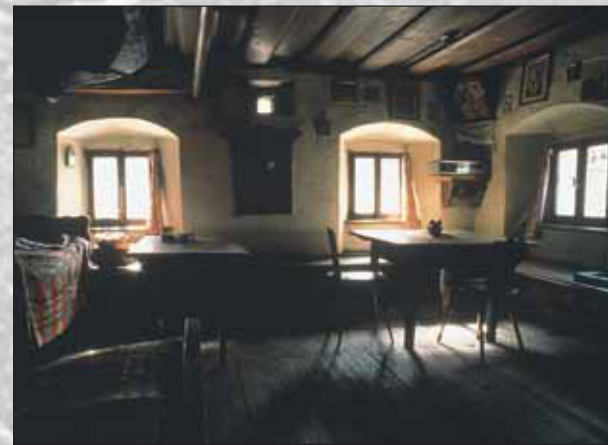
Osrednji prostor - hiša - leta 1993

Stanovanjska stavba je zidana, pritlična, tradicionalnega tlorisa, njeni prostori pa so nanizani na osrednjo vežo. Glavni bivalni prostor je "hiša" s "hišno kamro" in z letnico 1775 na stropnem tramu. Iz veže je dostop v črno kuhinjo, v kamro za preužitkarje in v klet za spravilo repe, zelja, korenja, krompirja. Iz veže vodijo tudi stopnice na podstrežje - na njem se ponovi tlorisna razporeditev prostorov, vendar v preprostejši izvedbi. Tu so v številnih skrinjah hranili oblačila in osebne