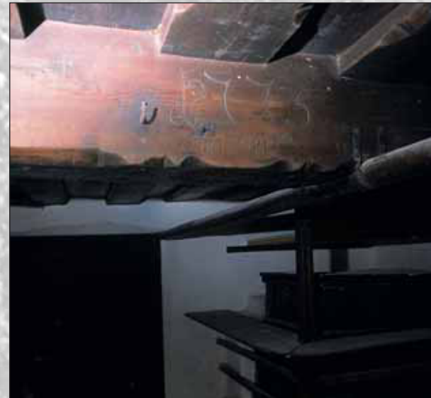
Letnica 1775 na hišnem tramu

Stanovanjska stavba je zidana, pritlična, tradicionalnega tlorisa, njeni prostori pa so nanizani na osrednjo vežo. Glavni bivalni prostor je "hiša" s "hišno kamro" in z letnico 1775 na stropnem tramu. Iz veže je dostop v črno kuhinjo, v kamro za preužitkarje in v klet za spravilo repe, zelja, korenja, krompirja. Iz veže vodijo tudi stopnice na podstrežje - na njem se ponovi tlorisna razporeditev prostorov, vendar v preprostejši izvedbi. Tu so v številnih skrinjah hranili oblačila in osebne