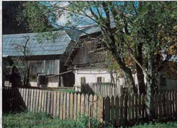
Garkel - manjši ograjen vrt - pred hišo

Bogastvo Pocarjeve domačije so bili gozdovi, pašniki, rovti, travniki in njive, posredno pa se njena gospodarska moč vidi v velikosti stanovanjske hiše in gospodarskega poslopja. Živinoreja in z njo povezane dejavnosti so zagotavljale glavni zaslužek in hrano za preživetje. Kljub obsežni posesti je bilo stavbišče za domačijo izbrano varčno in pretehtano. Ob nekdanji poti med travniki je v gručo strnjena stanovanjska hiša in gospodarsko poslopje ter manjši hlev za drobnico, leseni svinjak in stegnjeni kozolec.