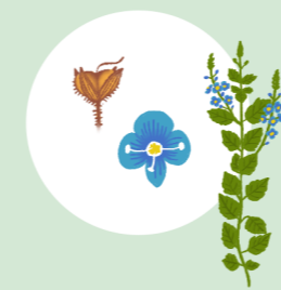
VREDNIKOV JETIČNIK (VERONICA CHAMAEDRYS)