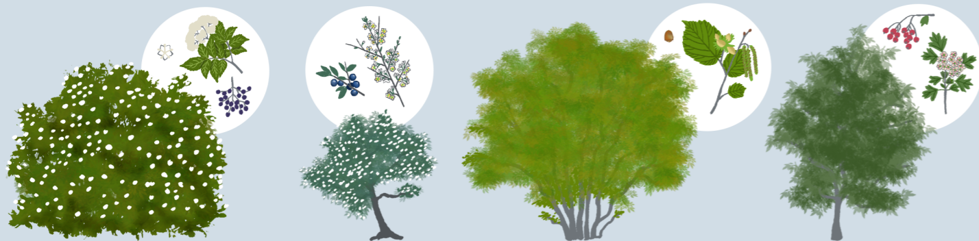
ČRNI BEZEG (SAMBUCUS NIGRA)