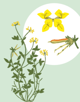
NAVADNA NOKOTA (LOTUS CORNICULATUS)