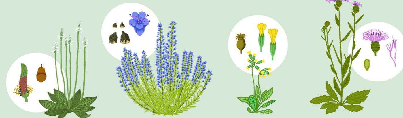
TRPOTEC (PLANTAGO MEDIA)