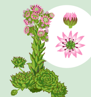
NATRESK (SEMPERVIVUM TECTORUM)