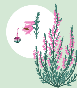
JESENSKA VRESA (CALLUNA VULGARIS)